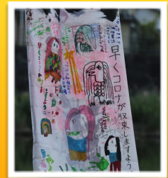
鯉のぼりに書かれた子ども達のお願い

悲しいことに新型コロナなかなか収束しません。大阪で異常に増えて、東京、北海道、福岡も昨日は500人の新規感染者が出ました。佐賀でも36人、全く油断できない状況です。ワクチン接種も少しずつ進んでいるようですが、中国武漢のワクチン源からイギリス株、インド株と変異してきているのも脅威です。しかしみなさん、日本でもシオノギのワクチン開発もありますし、先日は長崎大学で治療薬の治験が始まっているとのニュースもありました。ぜひ治療薬の開発に成功していただいて、日本と、このコロナに困窮している世界の人々を救済してほしい。祈るような気持ちで長崎大学には期待しています。