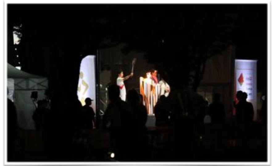
佐賀市最終ランナー 吉岡徳仁さん 5月10日(月)