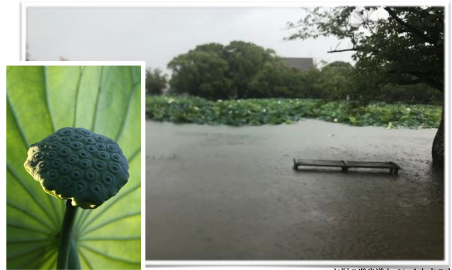
お堀の遊歩道もベンチも水の中