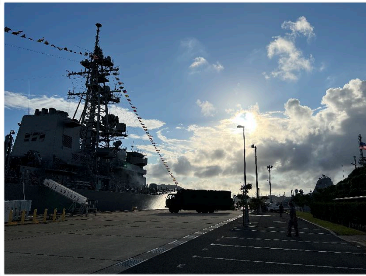
佐世保海上自衛隊 8月7日(日)フェスティバル終了頃